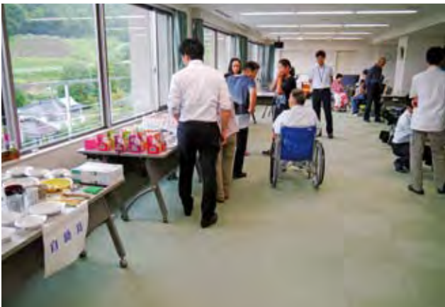
○介護用品展示相談コーナー