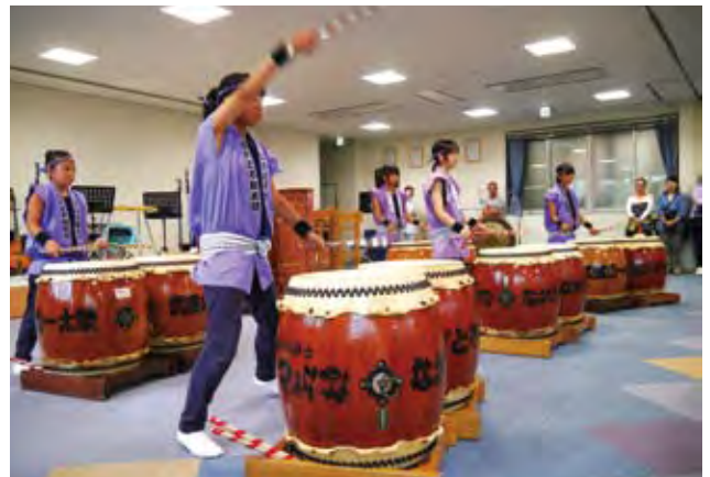
○フィナーレを飾った「ながと不動太鼓」