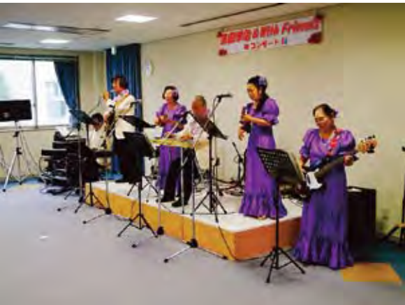
○ハワイアンバンド演奏