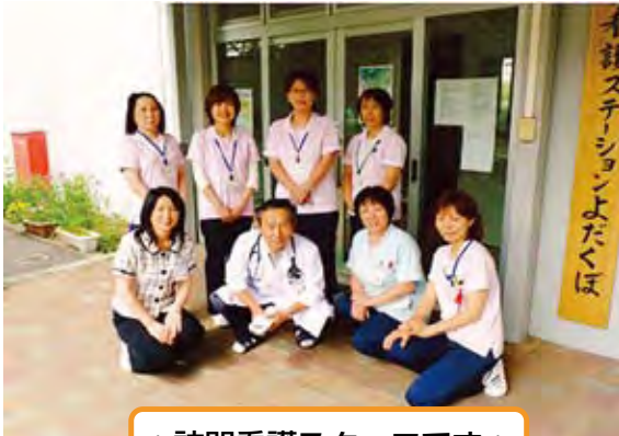
*訪問看護スタッフです*