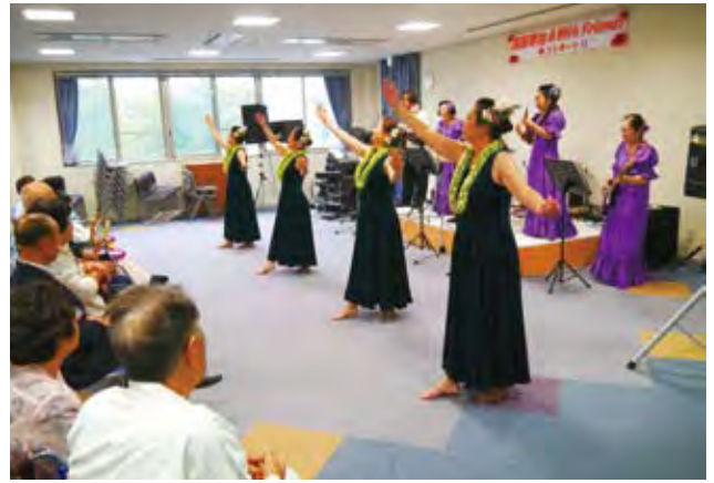
○ハワイアンダンス