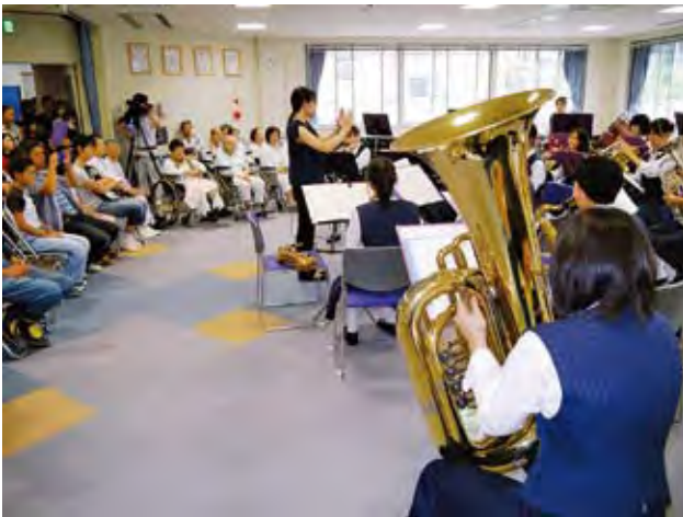
○依田窪南部中学校吹奏楽部によるオープニング