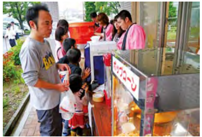
○子供たちに人気の模擬店