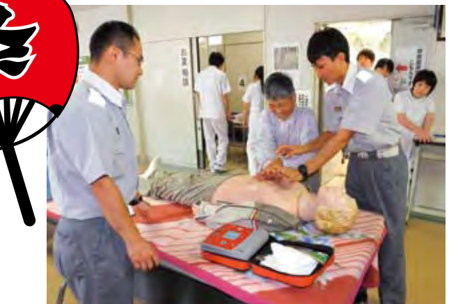
○依田窪南部消防署員によるAEDミニ講習