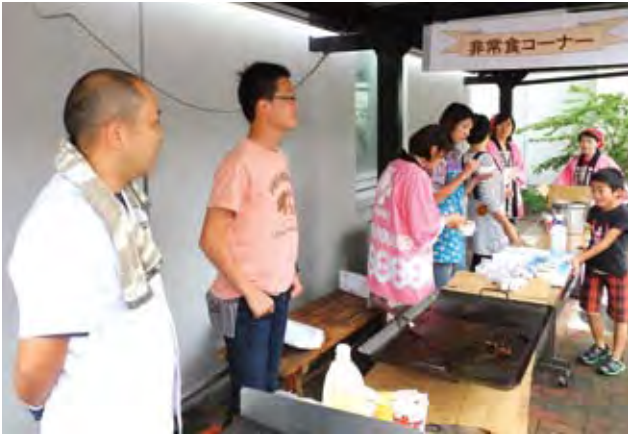
○非常食試食コーナー