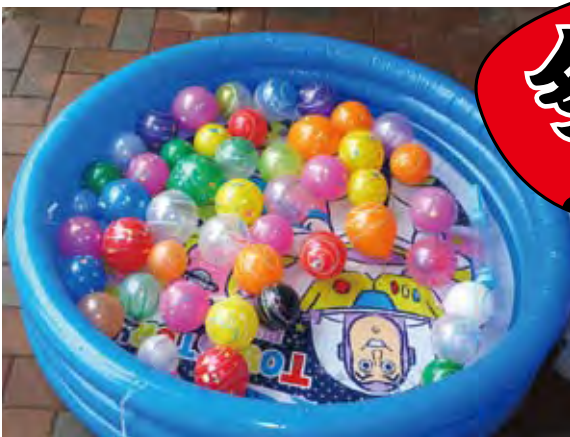
○祭りに色を添えたボンボン