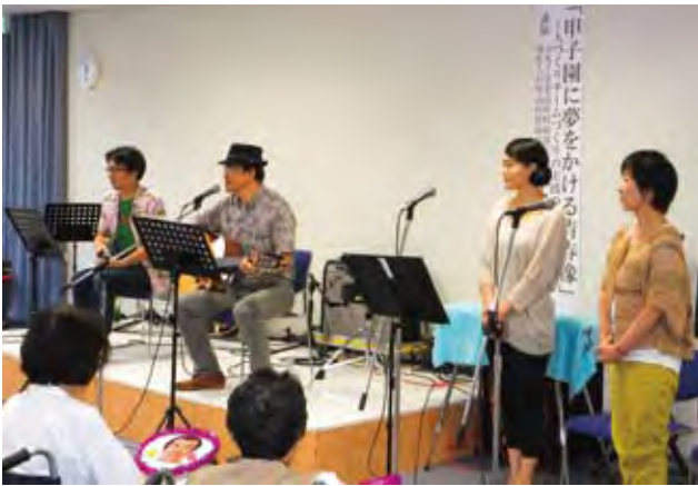
○三澤院長フォークグループ