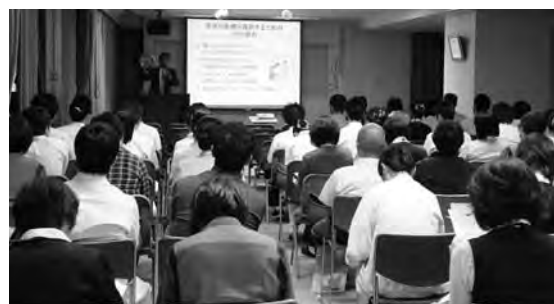
院内医療安全研修会

「医療の安全管理」をテーマに、「事故防止の危機管理」について、安全な医療を提供するための基本から、実際に行うべき対策などを研修しました。医療の安全確保のためには、患者様のご協力も不可欠です。よろしくお願いいたします。