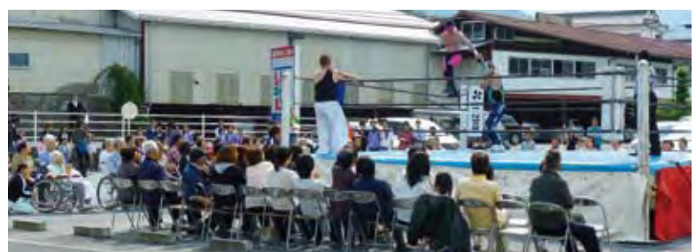
信州プロレス 依田窪病院マッチ