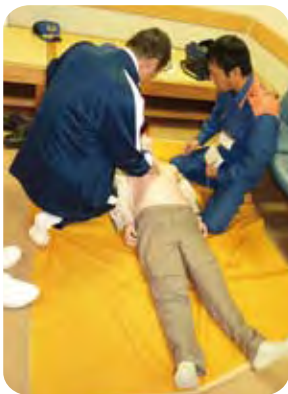
依田窪南部消防署 AED心肺蘇生術講習コーナー