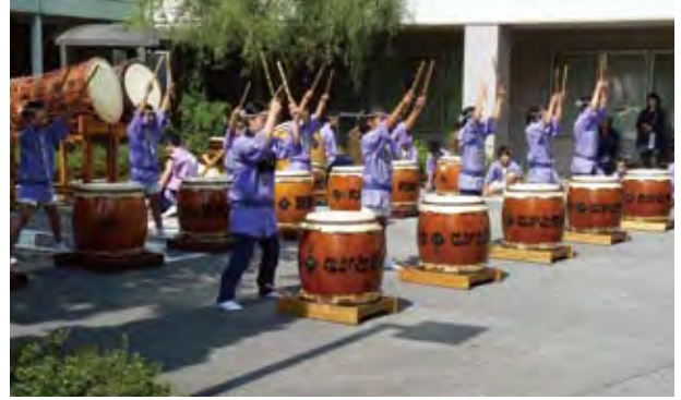
ながと不動太鼓の皆さん