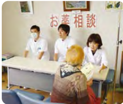
お薬相談コーナー