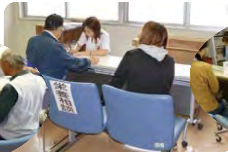
栄養相談コーナー