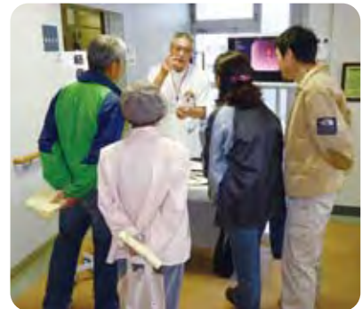
鼻から通す内視鏡の説明