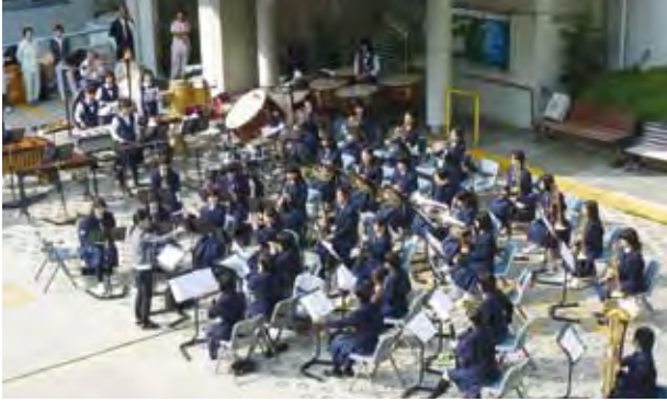
依田窪南部中学校吹奏楽部の皆さん