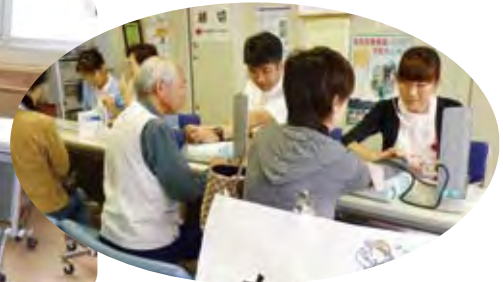
血圧測定コーナー