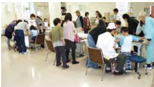
キーホルダー作りコーナー