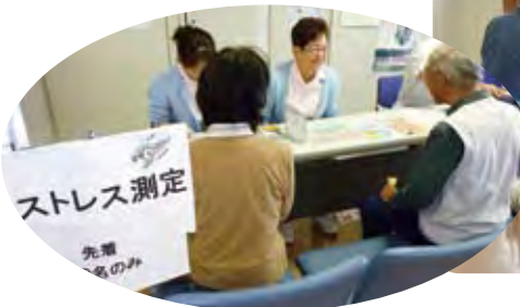
ストレス測定コーナー