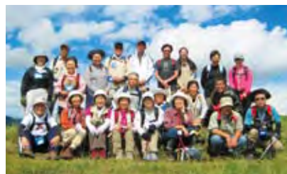
参加者の皆さんと

幸いこれまでの参加で体調不良を訴える方はいみせんでしたが、今後もこのような機会があれば、少しでもお役に立つことができたらと思っています。