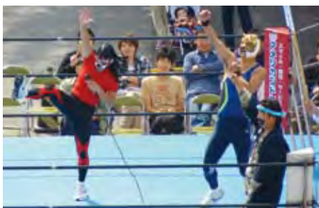
職員レスラーも参戦！