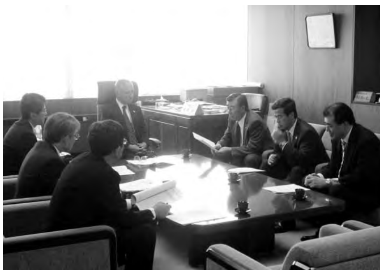
知事室で要望書を提出

今年度は、従来1人は確保できていた自治医科大学を卒業した医師（9年間の指定病院勤務義務）の県からの派遣を見送られてしまいました。また、新たな医師臨床研修制度の施行以来、信州大学医局からの医師派遣が難しくなり、現在当院の常勤医は、全体での定数充足率が8割に満たず（17/22人）、特に、内科、外科はそれぞれ3名の医師によりギリギリの診療体制しか取れない状況にあります。患者さんには外来待ち時間の延長、救急制限、入院制限など大変なご不便をおかけしており、一刻も早く十分な医師、看護師の確保ができるよう努めてまいります。住民の皆様にもご理解とご協力をお願いいたします。また、お知り合いに医師や看護師がおられましたら是非ともご紹介ください。